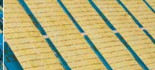
Первый этап – демонтаж кровли, утеплителя и старых плёнок.