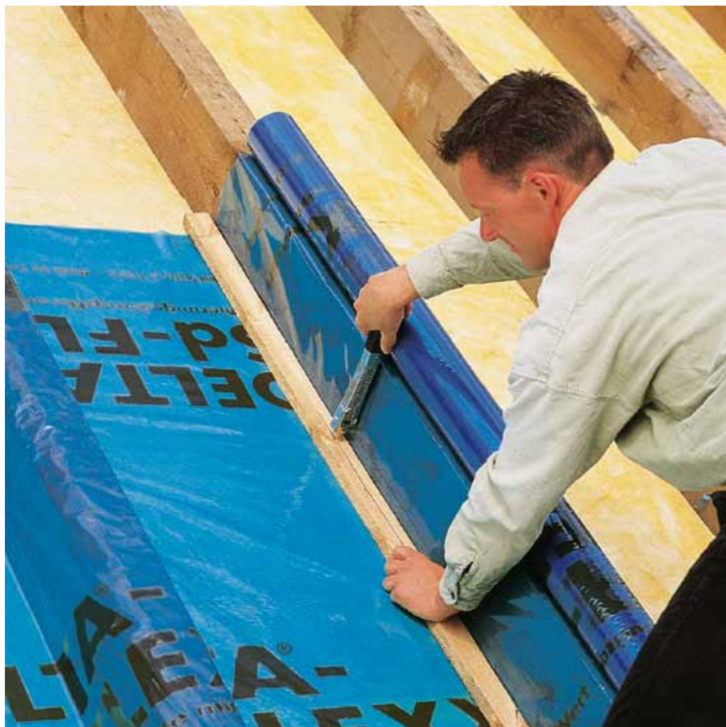
Плёнка DELTA®-Sd-FLEX монтируется очень быстро, снижая общее время проведения ремонта.